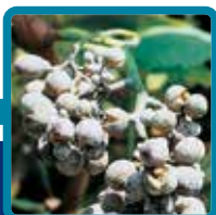
Oidio della Vite